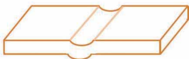
Rillen – Papierbogen im Detail